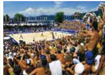
Zum 13. Mal findet das Grand Slam - Beach-Volleyball-Turnier in Klagenfurt am Wörthersee statt. Tausende Fans aus aller Welt sind, wie jedes Jahr, bei diesem glühenden Event dabei.