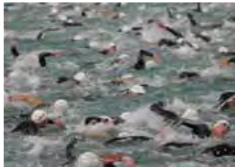
Der Kärnten IRONMAN Austria findet am 05. Juli 2009 zum 11. Mal statt. 3,8 km Schwimmen im Wörthersee, 180 km Radfahren in 2 Runden und 42,2 km Marathon.