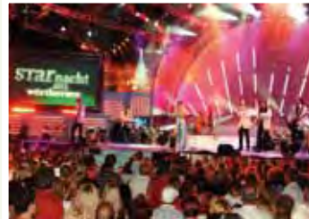
Beim Starnacht Weekend tummeln sich zahlreiche VIP's in Pörtschach am Wörthersee. Havana-Bar, coole Drinks und heisse Musik, da kommt bei den ca. 7000 Fans richtig Stimmung auf.