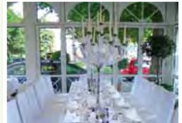
Fête Blanche 2009 Genießen Sie das Fest in Weiß rund um den Wörthersee am 24.07.2009. Vom Getränk bis zum stylistischen Outfit - alles ist in Weiß.