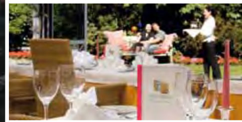
... und die sonnigsten Essplätze sind der Garant für erholsamen Urlaub.

Sonnengelb heiter das ganze Haus. Südliche Lebensfreude, gepaart mit dezenter Eleganz, erwarten Sie in unserem Stammhaus. Sie befinden sich direkt im Zentrum von Pörtschach und können nach Belieben bummeln, shoppen oder ins vielfältige Nachtleben eintauchen.