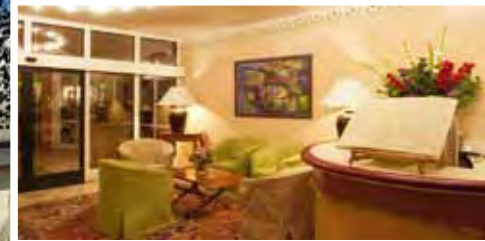
Gemütlicher Eingangsbereich ...