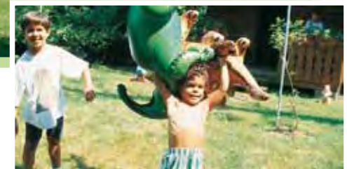
Paradies für Kinder

Familiär die Atmosphäre. Zentral und doch in ruhiger Lage, in einem 3.000 m 2 grünen Park mit üppigen Pflanzenwuchs, präsentiert sich das gemütliche Hotel Sonnengrund ideal für Ihren Familienurlaub. Während sich Ihre Kinder im großzügigen Garten mit Spielplatz vergnügen, genießen Sie entspannt unser kulinarisches Angebot auf der Gartenterrasse.